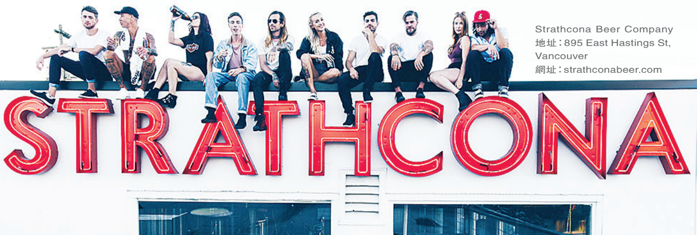
Strathcona Beer Company 地址：895 East Hastings St, Vancouver 網址：strathconabeer.com

Strathcona Beer Company不是一個人的事，而是一群好朋友的事——這班老友記因爲滑板運動、藝術、音樂等原因聚在一起，這群人雖來自不同背景、各有專業領域，但他們有相同的生活哲學、興趣與喜好，每當湊在一起，就能凝聚出強烈的向心力，他們稱之爲「community」。Strathcona Beer Company的誕生，就是將這個滑板community從虛幻變成實體。